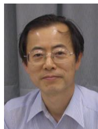
ジョークサロン 会計幹事鳥