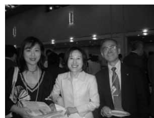
隣はダーレ、誰でしょう