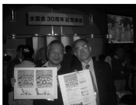
ジョークサロンも20年！

*怪鳥の知己・友人も多数参加してまして、怪鳥は巣箱の笑介に余念がありませんでした。