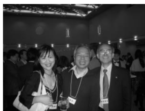
サロンに来てくれるかな