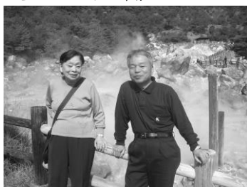
←無事地獄から帰還した母と息子