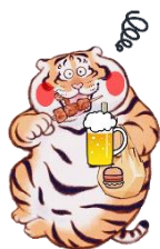
酔っぱらい 虎になった虎