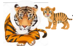
虎穴入らずんば虎児を得ず 虎穴虎子