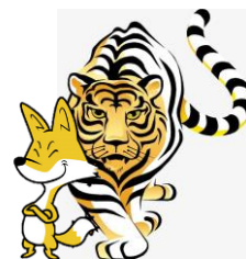
虎の威を借りるきつね 狐 仮虎威